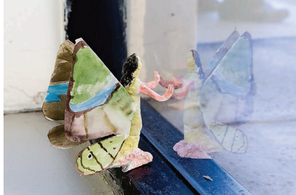
OBEN Installationsansicht Freedman Fitzpatrick, Los Angeles, 2015